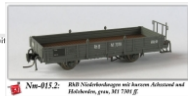
Nm-015.2: RAB Niederbordwagen mit hartem Achsstand auf Holzbohlen, grau, M1 7301 ff.