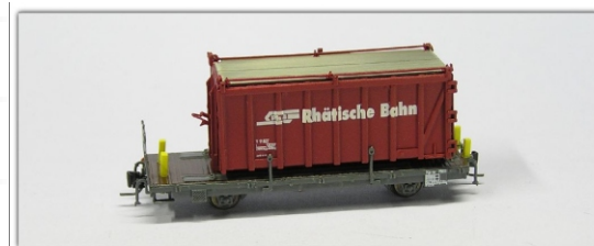
Nm-016.3: RhB Tragwagen für Abrollcontainer Kp-w 7501 ff. - mit Kehrlichtcontainer