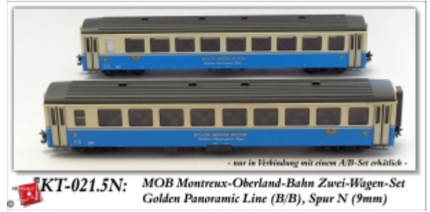
KT-021.5N: MOB Montreux-Oberland-Bahn Zwei-Wagen-Set Golden Panoramic Line (B/B), Spur N (9mm)