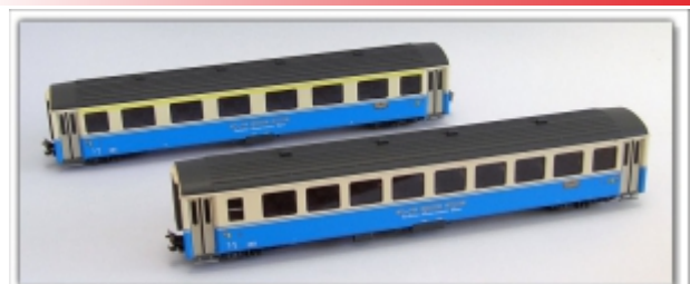
KT-021.4N: MOB Montreux-Oberland-Bahn Zwei-Wagen-Set Golden Panoramic Line (A/B), Spur N (9mm)

Vorbehaltlich Lieferbarkeit und Preisänderungen durch Kato