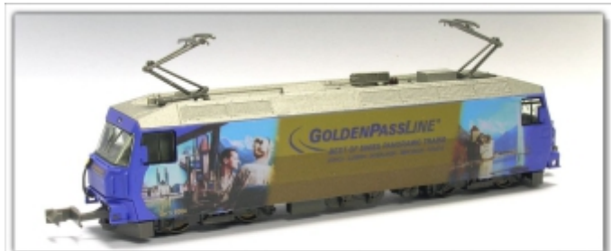
KT-021.3N: MOB Montreux-Oberland-Bahn Ge4/4 8002 / 8004 Golden Pass-Werbung, Spur N, N-Standard-Kuppl.

Sehr zur Freude der Besucher haben wir auf der Nürnberger Spielwarenmesse 2018 den brandneuen Golden Pass-Zug der MOB auf unserem Betriebsdiorama Wilderswil posieren lassen.