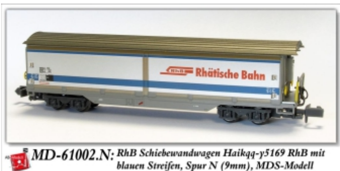
MD-61002.N: RhB Schiebewandwagen Haikqq-y5169 RhB mit blauen Streifen, Spur N (9mm), MDS-Modell