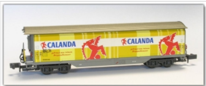
MD-61004.N: RhB Schiebewandwagen Haikqq-y5170 Calanda Bräu, Spur N (9mm), MDS-Modell

Schiebewandwagen mit Werbung der HG Commmerciale weiße Schiebewände mit aufwändiger Bedruckung gelbe Handräder