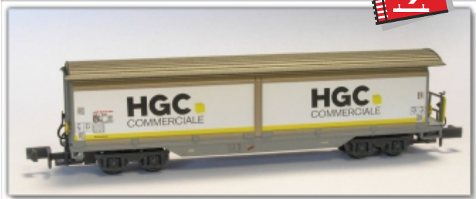
MD-61003.N: RhB Schiebewandwagen Haik-v 5134 HG Commmerciale, Spur N (9mm), MDS-Modell