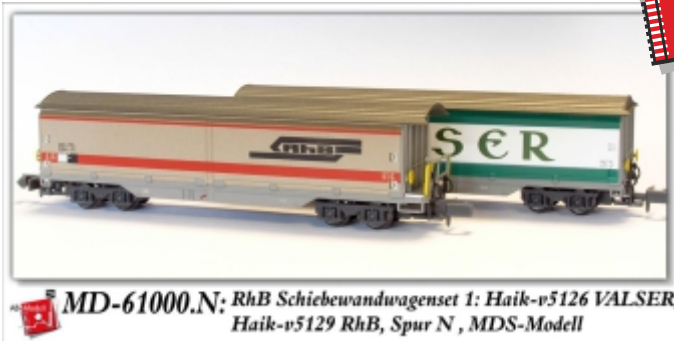
MD-61000.N: RhB Schiebewandwagenset 1: Haik-v5126 VALSER, Haik-v5129 RhB, Spur N, MDS-Modell