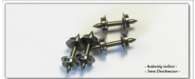
MD-61000.11: Tauschradsätze für MDS-Güterwagen, 4 Stück, zur Umspurung auf 6,5mm (N-Schmalspur)

- beidseitig isoliert - - 5mm Durchmesser -