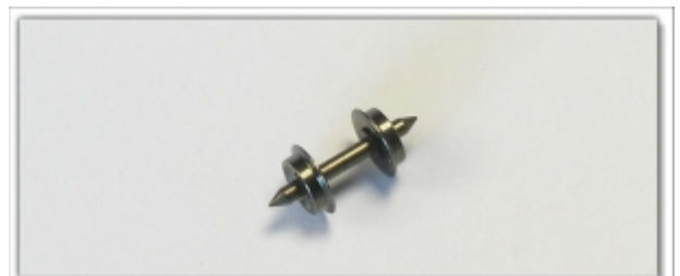
MD-61000.10: Tauschradsatz für MDS-Güterwagen, 1 Stück, zur Umspurung auf 6,5mm (N-Schmalspur)

Bitte beachten Sie, dass der geringere Durchmesser zu einer etwas niedrigeren Lage der Kupplung führt. Wir empfehlen daher, die Lokomotive mit der Wagenkupplung auszurüsten, um die Differenz möglichst gering zu halten.