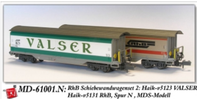
MD-61001.N: RhB Schiebewandwagenset 2: Haik-v5123 VALSER, Haik-v5131 RhB, Spur N, MDS-Modell