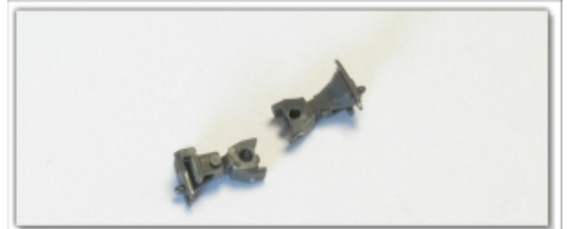
KT-096.6: Kato-Kurzkupplungsset für Personen- und Güterwagen, 2 Stück im Set

Auf unserer Testanlage durchführen die Modelle den Mindestradius von 150mm auch mit der Kurzkupplung ohne Probleme. Wir empfehlen Radien ab 183mm (Kato R2)!