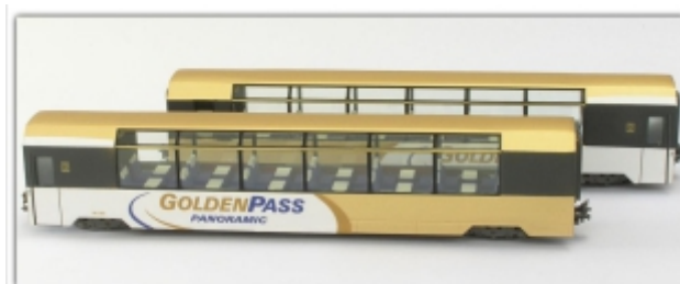
KT-021.7Nm: MOB Montreux-Oberland-Bahn Zwei-Wagen-Set Golden Pass Panoramic (Bs/Bs), Spur Nm (6,5mm)

Schmalspur Nm (6,5mm) mit Kato-Kurzkupplung