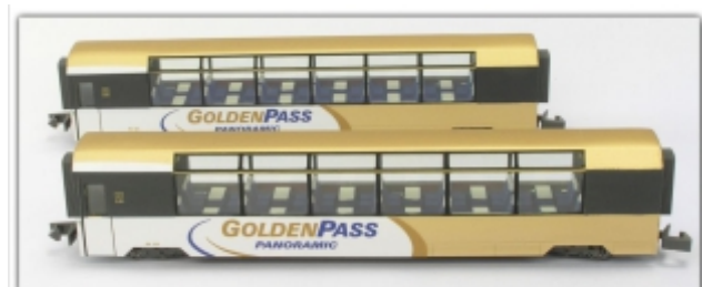
KT-021.6N: MOB Montreux-Oberland-Bahn Zwei-Wagen-Set Golden Pass Panoramic (As/Bs), Spur N (9mm)

Der GoldenPass Panoramic-Express wird seinem Namen gerecht und hat von uns eine goldene Lackierung erhalten.