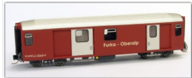
Nm-112.3: FO vierachsiger Gepäckwagen D4341 - 4342 mit silbernen Gepäcktüren, Furka-Oberalp

Neusilber-Handarbeitsmodell, ergänzt mit 3D-Druckteilen maßstäblich 1:160, für Spurweite 6,5mm (Nm) mit schmaler, silberner Zierlinie verfügbare Nummern D4210 und D4212