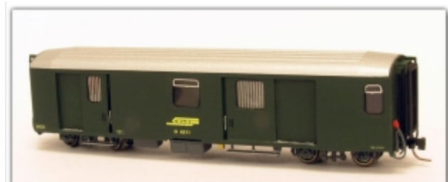
Nm-112.4: RhB vierachsiger Gepäckwagen D4210 - 4213, grün mit gelben Anschriften (1980er), Spur Nm (6,5mm)

Neusilber-Handarbeitsmodell, ergänzt mit 3D-Druckteilen maßstäblich 1:160, für Spurweite 6,5mm (Nm) mit breiter, hellgrauer Zierlinie mit roten Übergangstüren verfügbare Nummern D4211, D4212 und D4213