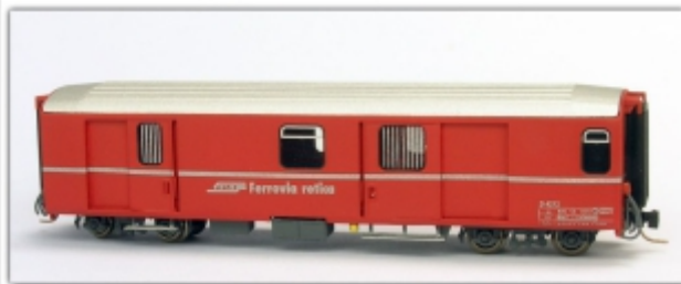
Nm-112.1: RhB vierachsiger Gepäckwagen D4210 - 4213 mit schmaler, silberner Zierlinie

Die gezeigten Modelle entsprechen dem üblichen Erscheinungsbild der 1990er Jahre mit silberner Zierlinie.