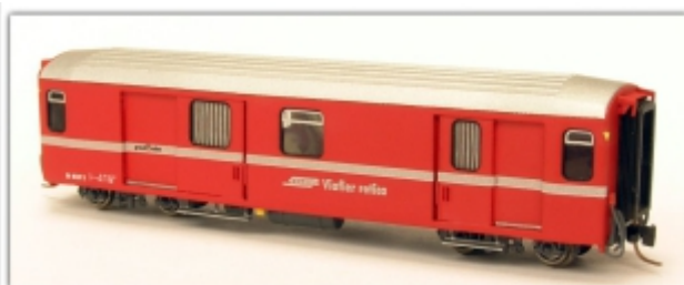
Nm-112.2: RhB vierachsiger Gepäckwagen D4210 - 4213 mit breiter, hellgrauer Zierlinie

Neusilber-Handarbeitsmodell, ergänzt mit 3D-Druckteilen maßstäblich 1:160, für Spurweite 6,5mm (Nm) mit silbernen Schiebetoren verfügbare Nummern D4341 und D4342