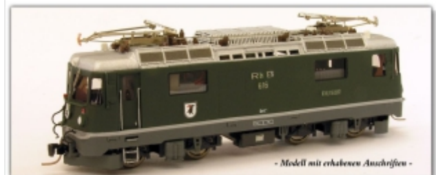
Nm-232.1: RhB Ge4/4" 616, grün, Wappen Filisur, Handarbeitsmodell, Faulhaber-Motor, Schwungmasse, Decoder

Neusilber-Handarbeitsmodell der RhB-Universallokomotive Ge4/4II Ausführung grün mit hellgrauer Schürze, RhB-Initialen und Gemeindewappen Thusis Modell mit runden Scheinwerfern