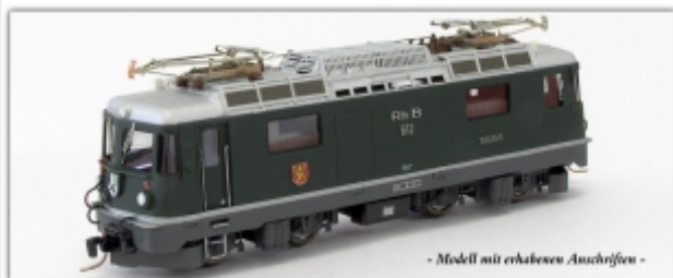
Nm-231.1: RhB Ge4/4" 612, grün, Wappen Thusis, Handarbeitsmodell, Faulhaber-Motor, Schwungmasse, Decoder

Heuer sind es zwei „Kleine Grüne“, die neu ins Programm kommen: Lok 612 und 616, mit Wappen und erhabenen Anschriften.