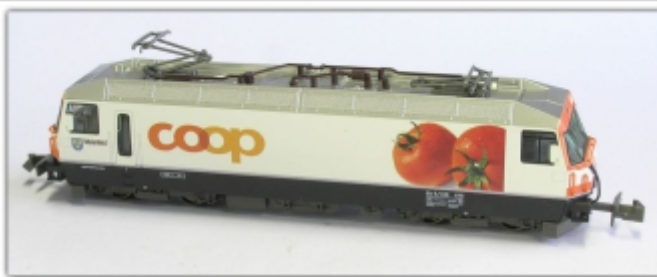
KT-052.5N: RhB Ge4/4 ''' 641 Coop, Spur N (9 mm), mit Rapidokupplung, Sondermodell NOCH