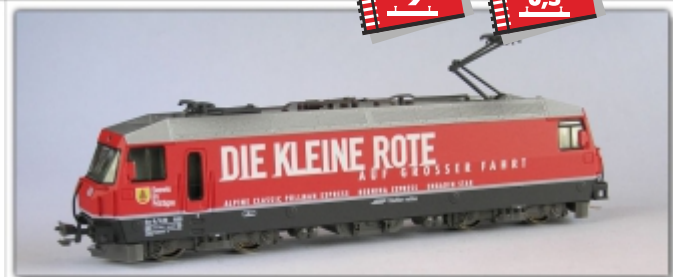
KT-055.1Nm: RhB Ge4/4 ''' 650 Die Kleine Rote, Spur Nm (6,5mm), mit Kato-Kurzkupplung, Fa. NOCH

Lackierung weiß mit Logo Coop und Tomatenmotiv